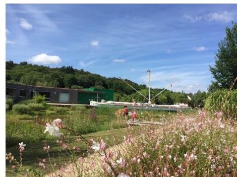
Cap Loire à Montjean sur Loire

Des ateliers créatifs et gourmands qui mettront les sens de vos enfants en éveil