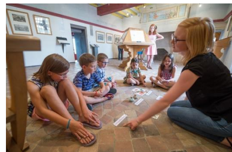
Animation au Musée du Bellay